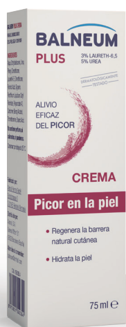
Crema 75 ml C.N. 155035.4