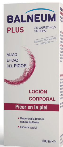
Loción Corporal 500 ml C.N.155034.7