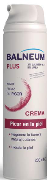
Crema 200 ml C.N.155037.8