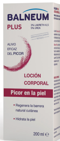
Loción Corporal 200 ml C.N. 155033.0